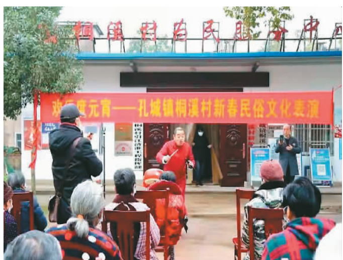
孔城镇民俗文化表演。