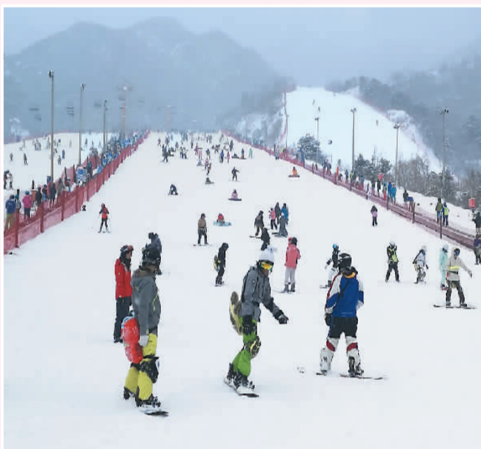
寒假期间，北京各大滑雪场吸引众多家长带孩子前往体验学习滑雪。图为游客在北京怀北国际滑雪场内滑雪。