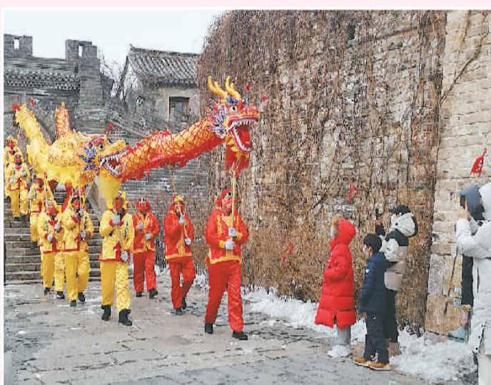
孩子们在北京古北水镇内驻足观看舞龙表演。

日前，全国中小学相继开学。在“双减”之后的第一个寒假里，学生们有了更多时间走进大自然、参与社会实践活动。走出家门，去冰雪世界里体验冰雪运动的快乐、在文化旅游点感受传统文化魅力、到红色景点接受革命精神熏陶，丰富多彩的活动让学生们的这个假期更加生动、更有新意。