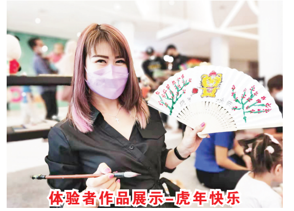
体验者作品展示-虎年快乐

【本报讯】虎年新春佳节之际,为向印度尼西亚坤甸市市民推广介绍中华优秀传统文化,丹戎布拉大学孔子学院于2月11日、12日、13日在坤甸市Gaia Bumi Raya City商场成功举办虎年新春中华文化展览体验活动。