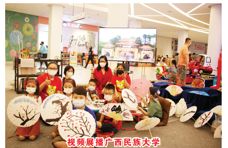
视频展播广西民族大学