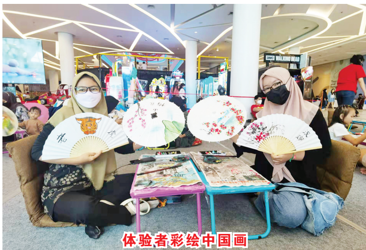
体验者彩绘中国画