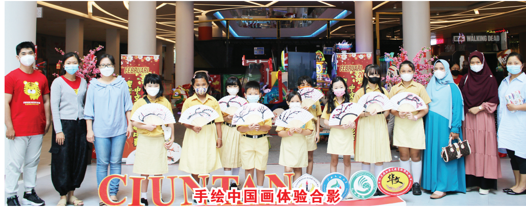
手绘中国画体验合影