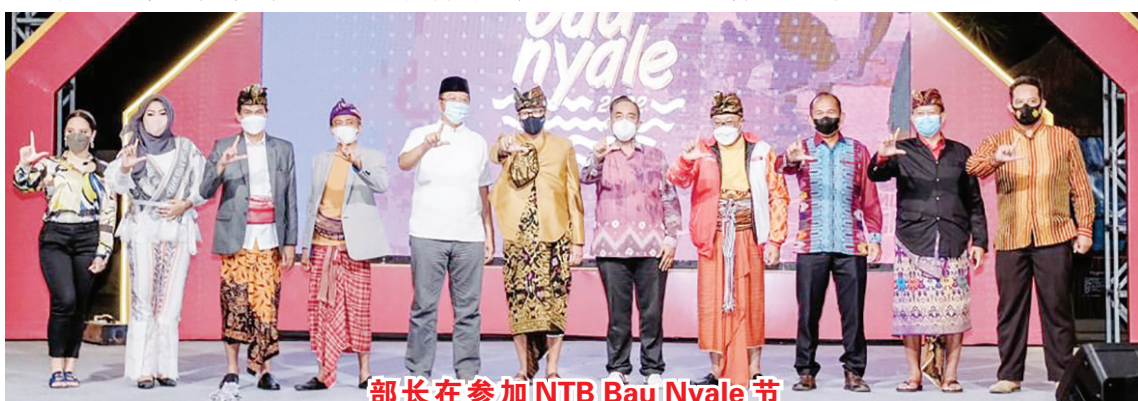
部长在参加NTB Bau Nyale 节

他表示,旅游和创意经济部感谢 NTB 地区政府迅速采取行动预测住宿价格上涨的努力,因为住宿和交通都显着增加。甚至西努沙登加拉省省长也在2月17日星期四发布了2022年第9号省府决定书,规范了住宿服务业务的实施,并规定了上限费率和住宿,以免混淆。 Bam/明光