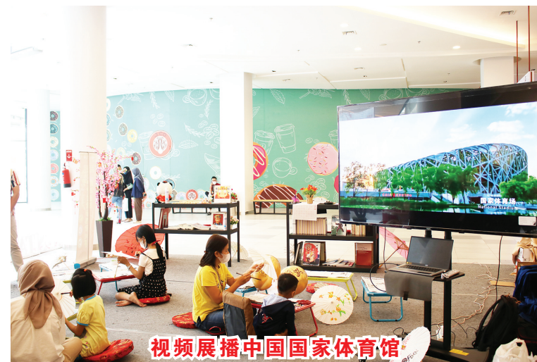
视频展播中国国家体育馆