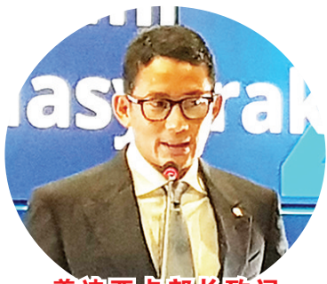
善迪亚卡部长致词

【本报讯】2022年2月21日(星期一)旅游和创意经济部长善迪亚卡·萨拉胡丁·乌诺 (Sandiaga Salahudin Uno) 在雅加达 Sapta Pesona 大楼举行的每周新闻发布会上表示,他将承诺彻底调查目前在巴厘岛盛行,不负责任的旅