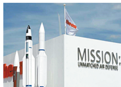
◆雷神公司業務以導彈系統為主。