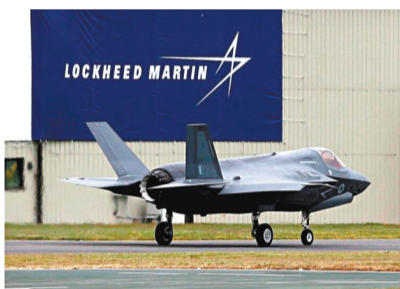
◆洛克希德-馬丁公司以研發戰機為主要業務。