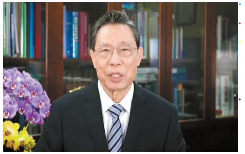
鍾南山就本港疫情，以廣東話錄製影片為港人打氣。影片截圖

第三是儲備藥物治療，如美國的 Paxlovid、中國內地 BR11 196-198 抗體、某些經循證醫學證實有效的中成藥，對於減輕症狀、縮短療程、減少重症的發生率是有效的。鍾南山稱，已有有關企業及廠家聯繫過，希望他們對香港給予更大的支持，得到企業積極肯定的回應。