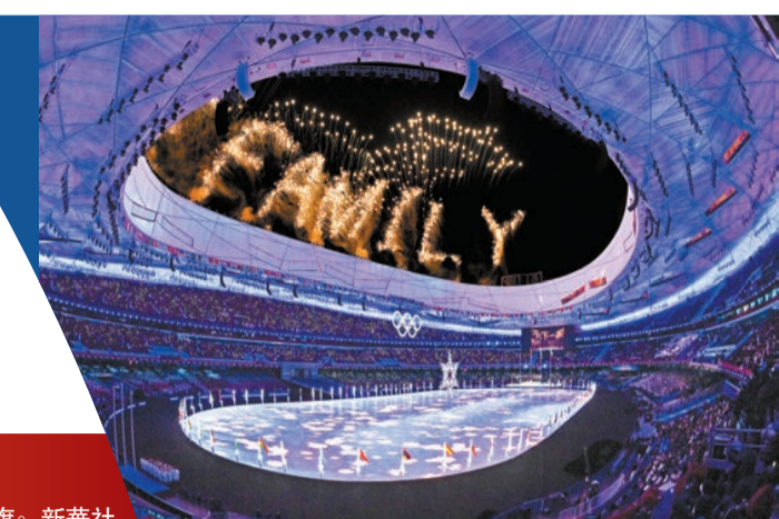
閉幕式上的焰火表演。