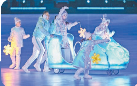
閉幕式現場表演。

閉幕式主創團隊成員接受記者專訪時表示，「閉幕式上時空穿梭，2008與2022在『鳥巢』交匯。2008年北京奧運會，是中國與奧林匹克第一次『牽手』，向世界展示了中國五千年的燦爛文明和對世界的貢獻。北京2022冬奧會更立足於未來，通過藝術手段傳遞新時代我們『一起向未來』的理念和主張。」