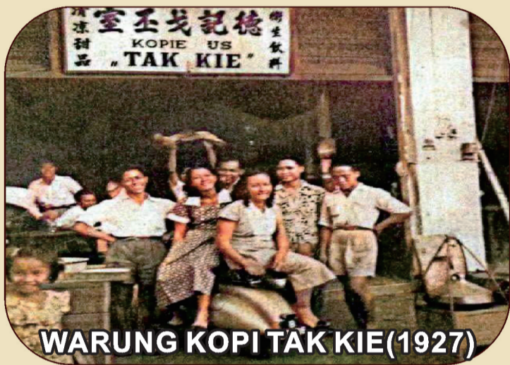
WARUNG KOPI TAK KIE (1927)