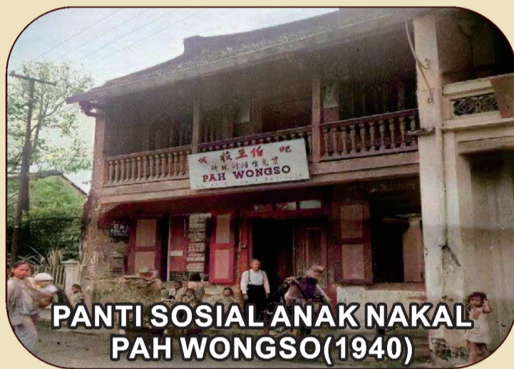
PANTI SOSIAL ANAK NAKAL PAH WONGSO (1940)