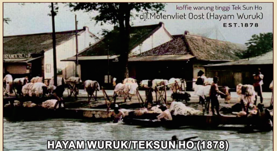
HAYAM WURUK/TEKSUN HO (1878)