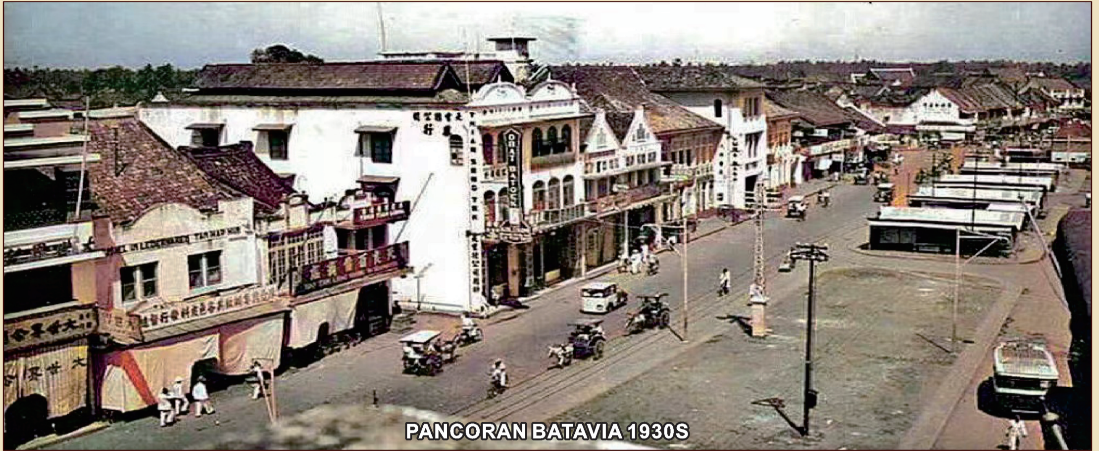
PANCORAN BATAVIA 1930S

POTRET PANTJORAN GLODOK TEMPO DULU ZAMAN KOLONIAL BELANDA