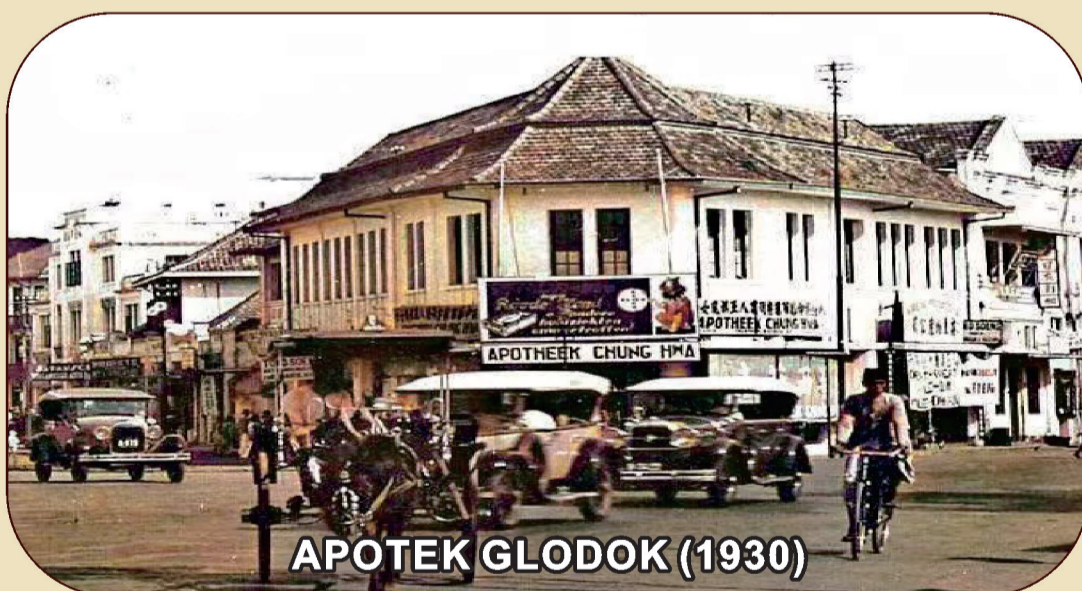
APOTEK GLODOK (1930)