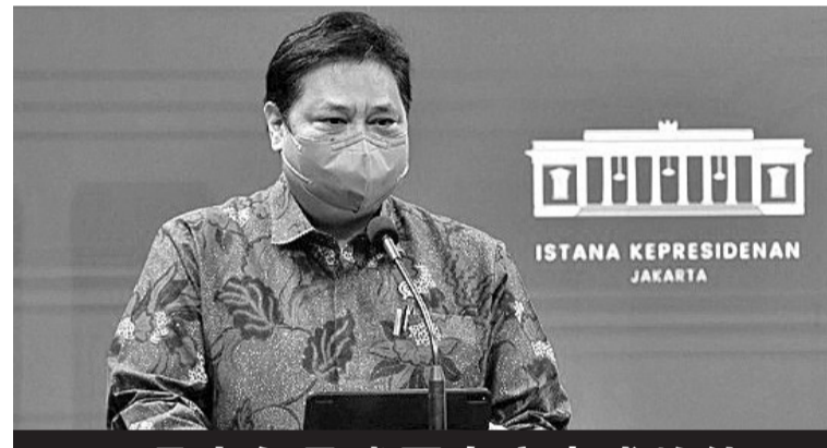
三月中旬是我国奥密克戎峰值 经济统筹部长艾朗卡·哈达托(Airlangga Hartarto)在雅加达召开记者会时声称,今年三月中旬是奥密克戎变体病毒疫情达最高峰时期。