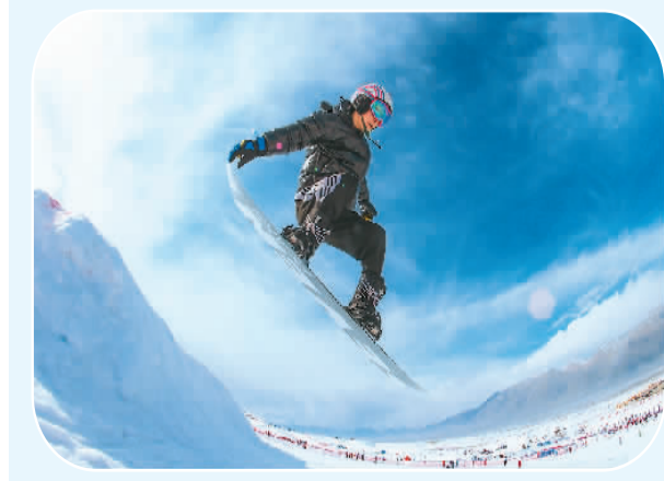
游客在新疆维吾尔自治区温泉县越野滑雪场滑雪。

笔者建议，要加强冰雪旅游供给改革和需求引导，持续培育大众冰雪旅游市场，建设世界级的现代冰雪旅游产业。着眼于国内和国际两个市场，以国际化、产业化、全域化、品质化为导向，构建世界级冰雪旅游大国产业体系。深入挖掘中国冰雪文化的内涵，以文化提升冰雪旅游产品吸引力，加快推动冰雪文化的市场化、产业化和国际化，向国际游客展示中国冰雪文化的独特魅力。