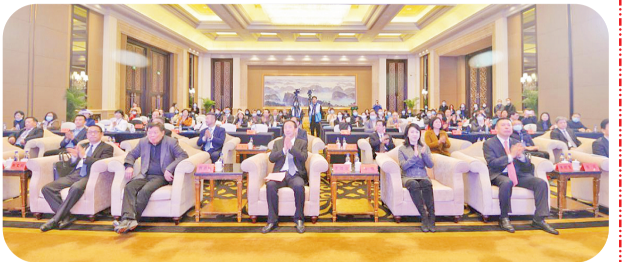
2022海丝华文媒体发展论坛现场。