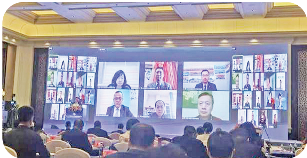
2022海丝华文媒体发展论坛部分在线与会者。

方人对中国充满好奇,他们希望了解中国的历史、中国的文明,希望了解中国今天正在发生的事情。“中国传媒需要在国际上把中国真正的形象传递出