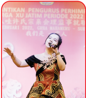
东爪许氏宗亲会演唱