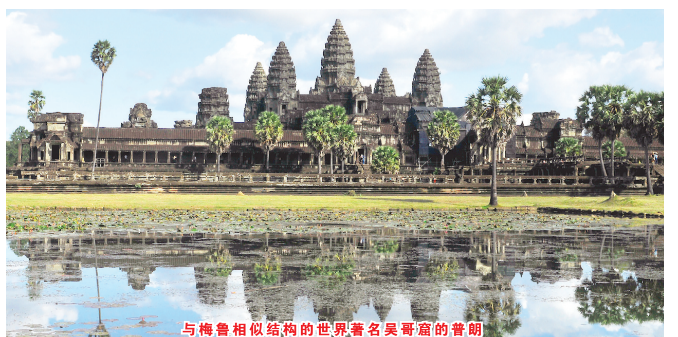
与梅鲁相似结构的世界著名吴哥窟的普朗