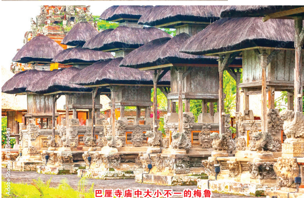
巴厘寺庙中大小不一的梅鲁