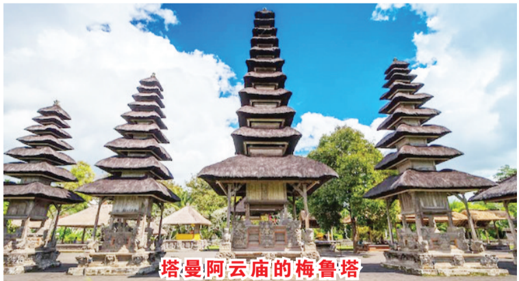
塔曼阿云庙的梅鲁塔

崖旅游景区)共3层的梅鲁塔最顶层是纪念传奇的印度教牧师 Dan Hyang Nirartha。 此外，更多规模层数较少的梅鲁塔一般最高层献给当地的神灵或祖先。 本报记者 叶露