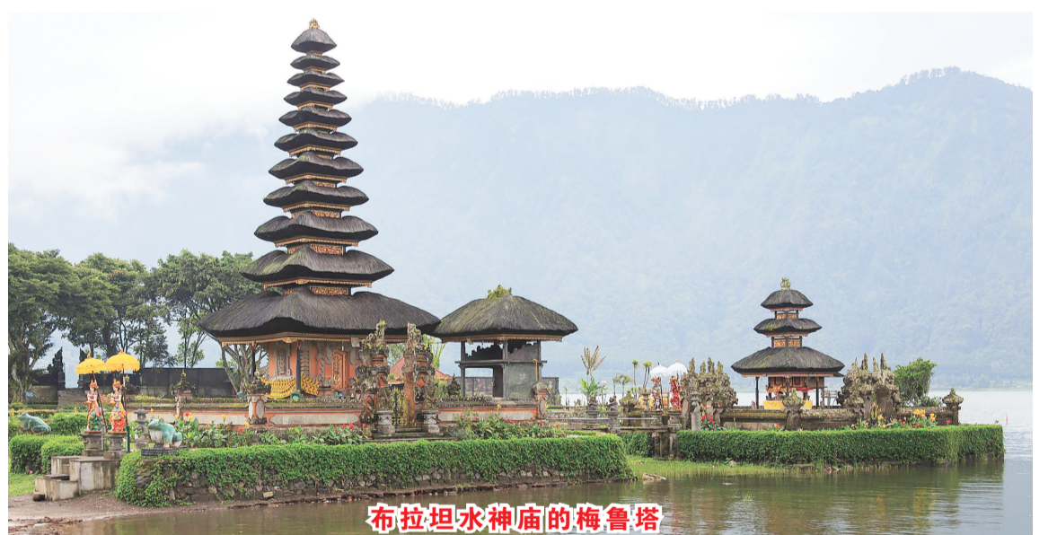
布拉坦水神庙的梅鲁塔

其宝塔式的梅鲁塔一般用称为“ijuk”的棕榈树黑纤维编制，遵循巴厘岛上传统住宅的建筑哲学—Asta Kosala Kosali(湿婆为中心，以山脉和海洋的轴线及日落日出轴线划分成九个不同功能区域)，并随着层次的上升以奇数层数而缩小，最高可达到11层。 梅鲁塔的每一层都是各位神灵的暂居住处。作