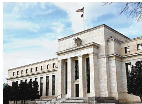
◆ 美國聯儲局應對通脹之時，有些投資者正迅速縮減對高增長股的投資。