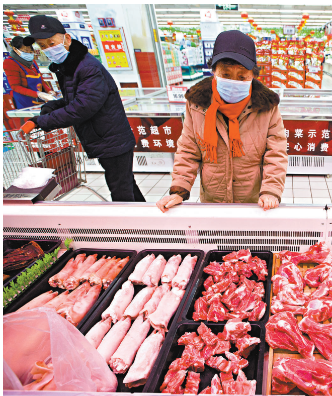
◆ 1月中國CPI同比上漲0.9%，漲幅比上月回落。其中，豬肉價格下降41.6%，降幅擴大4.9個百分點。