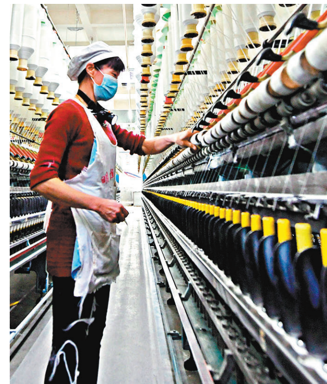
◆ 中國煤炭、鋼材等行業價格走低，帶動中國工業品價格整體回落。 中新社