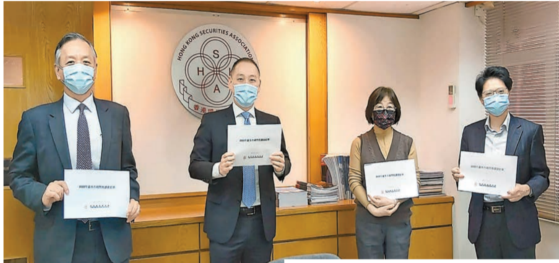
綠色和可持續金融跨機構導師小組再次確認將香港發展成為綠色金融樞紐的承諾，對業界有何影響？

香港證券業協會於1月12日至24日向旗下會員進行調查，共收回206份問卷。調查結果顯示，若「跨境理財通」容許證券商參與，多達66%的受訪會員，將會參與「跨境理財通」。調查結果又發現，22%的受訪會員認為，若香港發展成為綠色金融樞紐，將有助香港證券界推動綠色投資。李惟宏認為，業界需要