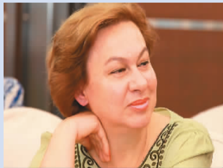
莉亚娜·阿尔索夫斯卡近照

1981年，18岁的南斯拉夫姑娘莉亚娜·阿尔索夫斯卡面临人生的重要抉择——以优异成绩高中毕业的她，获得了一份由西班牙教育部提供的留学奖学金。去哪里？中国、美国还是英国？尽管对中国了解不多，她还是脱口而出：“我想去中国”。从学中文、教中文，到编写汉语语法书，从给中墨两国领导人做翻译，到译介中国文学作品，几十年间，她从一个中国文化“小白”成长为名副其实的“中国通”。访谈中，莉亚娜追忆往昔，不无感慨地说：“去中国留学，是我这辈子最后悔的一件事。”