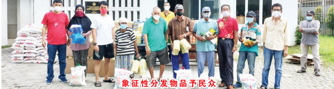
象征性分发物品予民众

【本报讯】2022年2月13日(周日)中午2时,菩提乐园基金会于棉兰-民礼13.8公里路,星光村内日里棉兰扶轮社诊疗所前广场,举行分发180套日需物品予乐园周围民众活动。菩提乐园基金会辅导