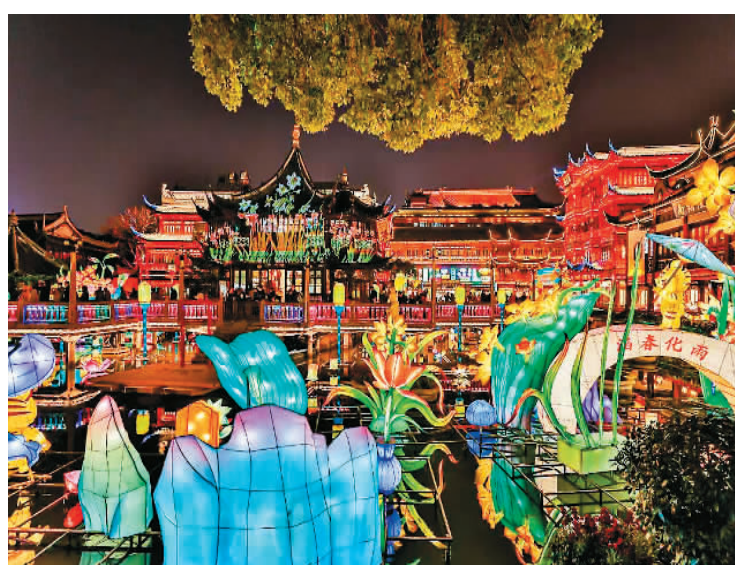
上海豫园内的灯彩景观。

豫园的街区充满年味，豫园的楼宇也充满年味，构思精巧的羊皮宫灯、海派灯饰、传统花灯、校场年画花灯分别置于华宝楼、上海老街等点位，让人们转角遇到惊喜。