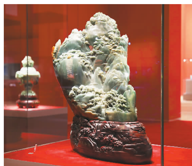
翡翠山子《岱岳奇观》。