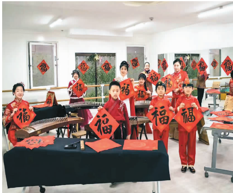
日前，日本横滨中华艺术学校主办了一场“挥春送福”活动。