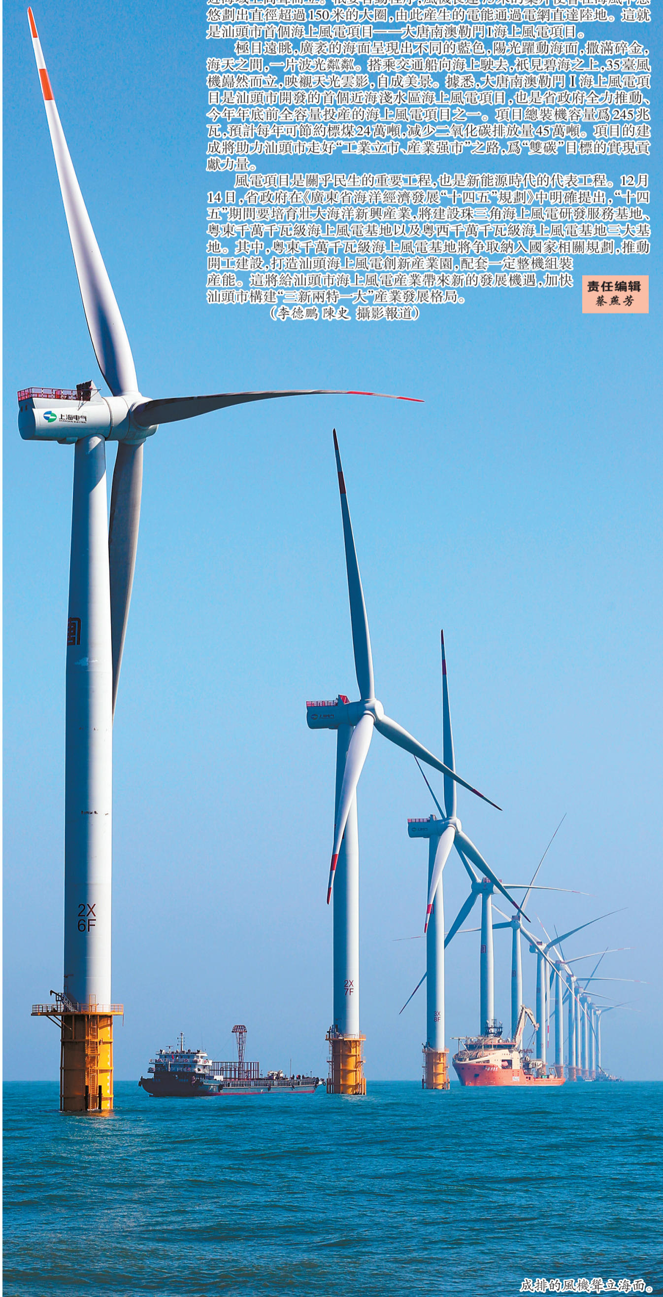
成排的風機聳立海面。