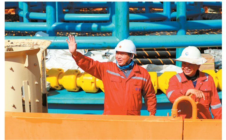
→項目順利建成,建設者們露出笑容。