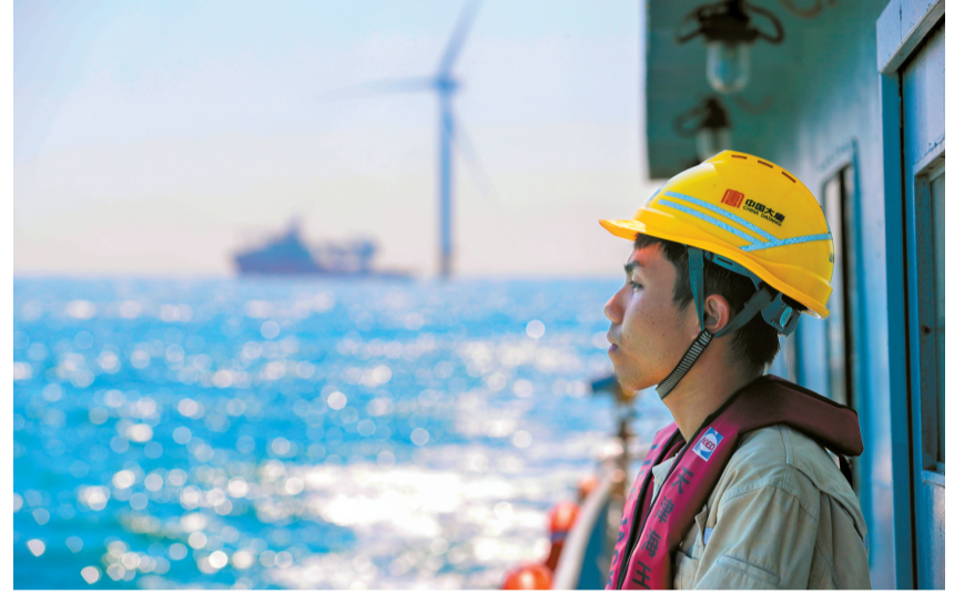
↑建設者守望着海上風電。