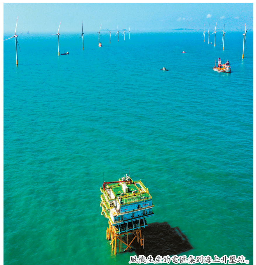
風機生產的電匯集到海上升壓站。