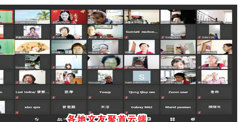
各地文友聚首云端