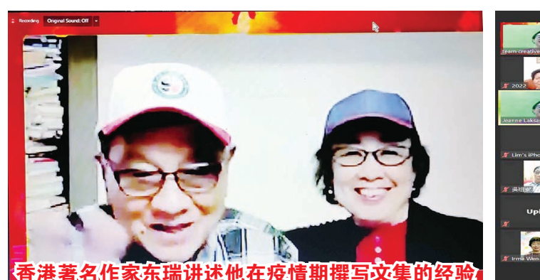
香港著名作家东瑞讲述他在疫情期撰写文集的经验