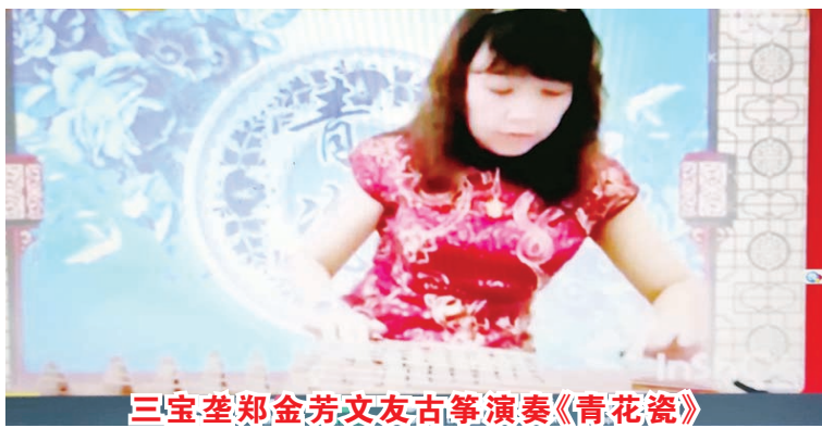
三宝叁郑金芳文友古筝演奏《青花瓷》