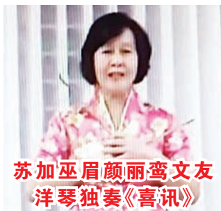
苏加巫眉颜丽鸾文友洋琴独奏《喜讯》