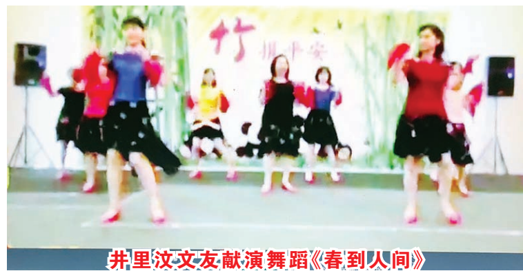
井里汶文友献演舞蹈《春到人间》