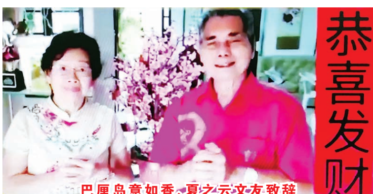
巴厘岛意如香、夏之云文友致辞