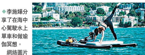
◆ 李施嬅分享了在海中心駕駛水上單車和做瑜伽冥想。

天過得太充實了……一家人一起感受了聖誕、跨年、農曆新年等等……也超開心！有很多好爸爸、好媽媽的陪伴。」吳尊分享的照片中，亦有陳浩民及內地主持人謝娜等，他在內地工作也認識了不少新朋友。