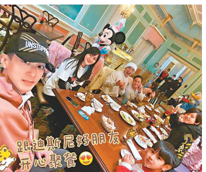
◆ 吳尊疫情下仍抱正能量生活。