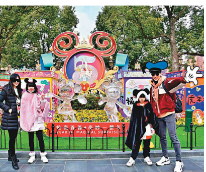
◆ 吳尊與妻子女去迪士尼度假。