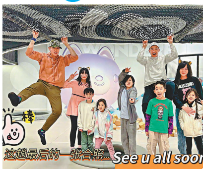
◆ 吳尊與家人親友度假玩得很開心。