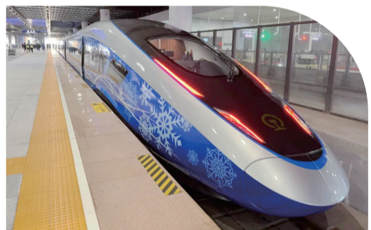
【中車四方生產的冬奧列車亮相京張高鐵。】

第24屆冬季奧林匹克運動會已拉開帷幕，世界各國運動員共赴這場冰雪盛宴。青島的運動員、教練員也深度參與其中，為北京冬奧會貢獻着“青島力量”。