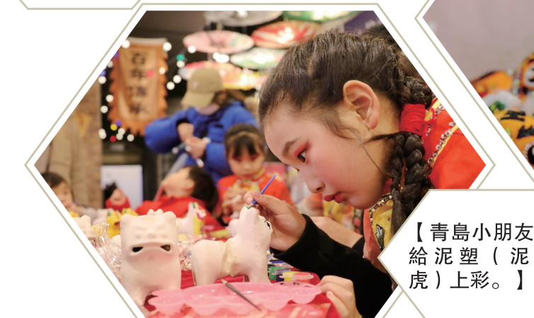
【青島小朋友在給泥塑（泥老虎）上彩。】