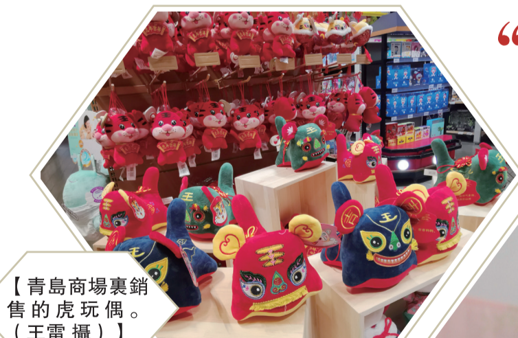
【青島商場裏銷售的虎玩偶。】