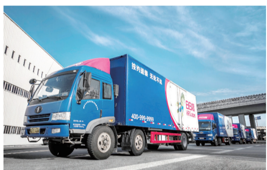
【青島日日順供應鏈入選“山東省民營企業100強”。】

青島近日提出，2022年將以創建全國民營經濟示範城市為主線，實施民營經濟壯大計劃，力爭全市民營市場主體年內突破200萬戶，民營企業突破75萬戶，民營經濟稅收、進出口占比60%以上，新吸納就