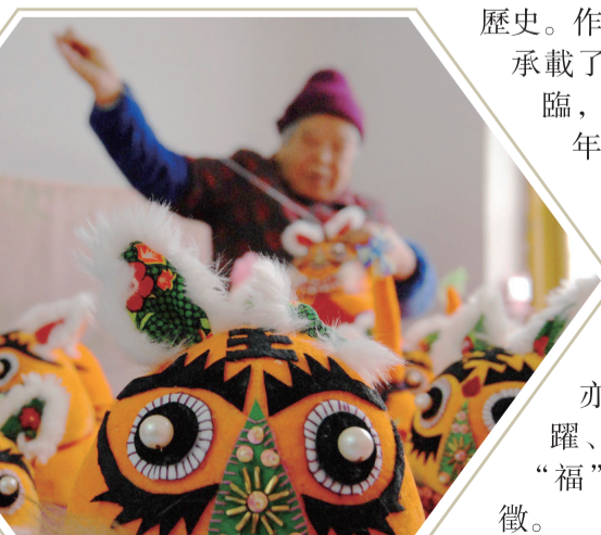
【青島即墨農民手工制作布老虎。】