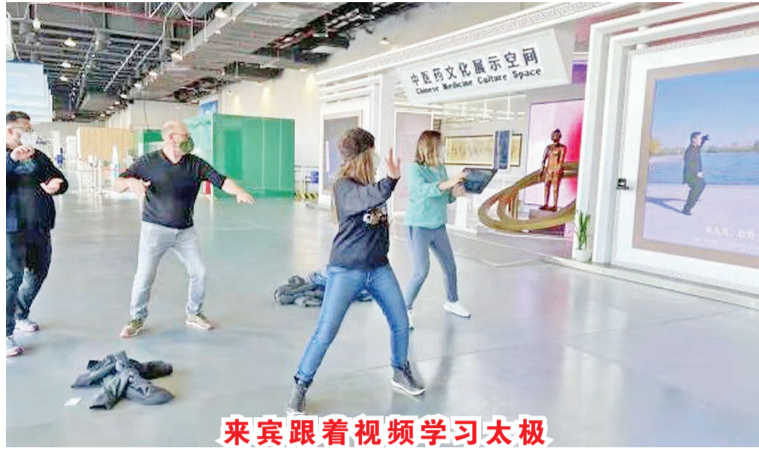
来宾跟着视频学习太极