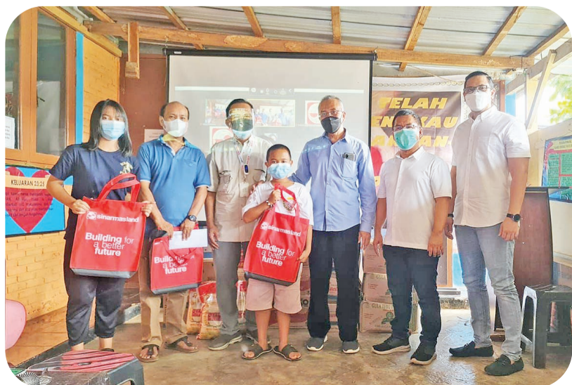
在丹格朗 Dangdang 村 Beriku Bakti 孤儿象征性分发礼包后合影