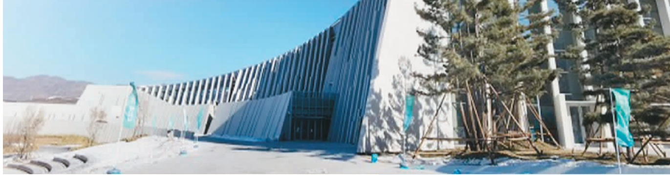
位于河北省张家口市崇礼区的华侨冰雪博物馆外景。

走进华侨冰雪博物馆，琳琅满目的冬奥主题展品，无声讲述着全球华侨华人与冬奥会的故事及对北京冬奥会的密切关注。