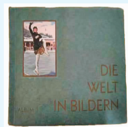
德国中华文化促进会捐赠给华侨冰雪博物馆的一九二八年第二届冬奥会纪念图册。