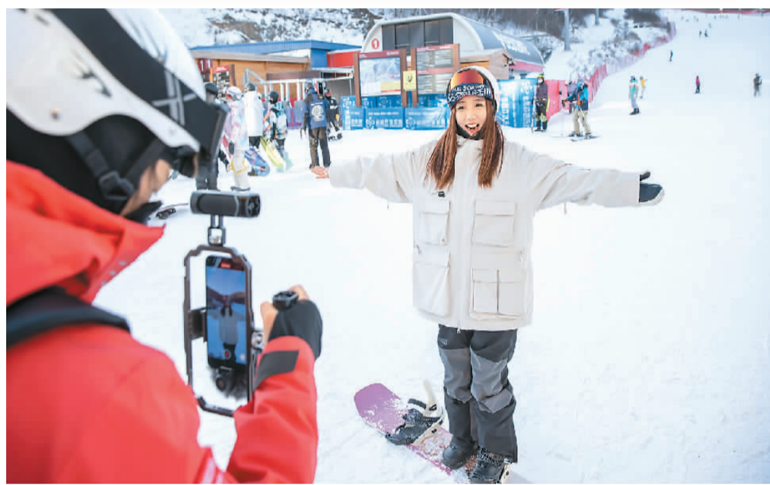
博主在河北崇礼云顶滑雪场录制视频。

祺这样的“多面型”人才提供了副业创新、创造价值的新途径。目前，越来越多人拥有多方面的知识和能力储备，可以同时满足不同企业的需求。一些人还凭借一技之长在新经济领域进行创新，创造出系列有价值的作品、产品，为自己带来更广阔的发展空间。国务院近日印发的《“十四五”数字经济发展规划》明确提出，鼓励个人利用社交软件、知识分享、音视频网站等新型平台就业创业，促进灵活就业、副业创新。