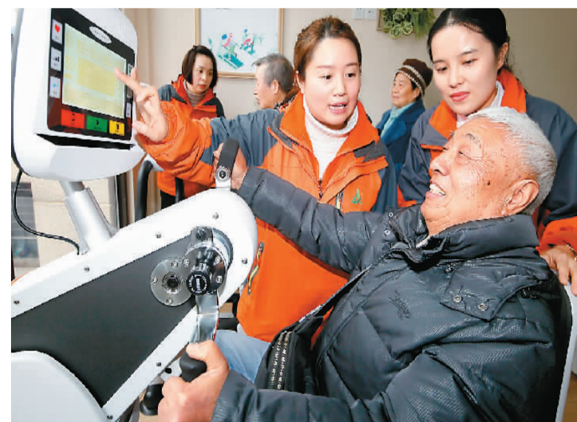
在重庆万盛经开区万盛街道安博馨社区“智慧养老”服务站，服务人员教老人使用智能健身器材。