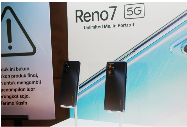
OPPO Reno7 智能手机

可以模仿天空中的星軌圖案，在 OPPO Reno7 5G 的背面制作出獨特的圖案。” Reno 系列是眾所周知的標誌性設備，尤其是在設計方面。作為智能手機背面防眩光 (AG) 工藝的先驅，OPPO 不斷努力在製造過程中開發技術，以便能夠