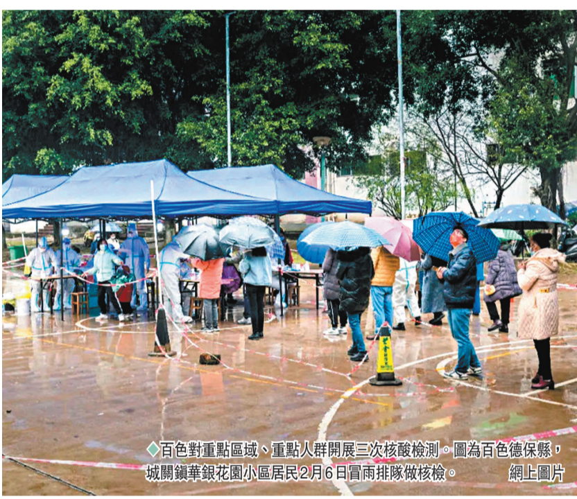
◆ 百色對重點區域、重點人群開展三次核酸檢測。圖為百色德保縣, 城關鎮華銀花園小區居民2月6日冒雨排隊做核檢。