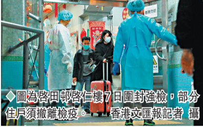
◆ 圖為啓田醫院仁樓7日圍封強檢, 部分住戶須搬離檢疫。