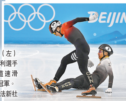
◆ 任子威 (左) 力壓匈牙利選手奪取短道速滑1,000米冠軍。

對於蘇翊鳴的出色表現, 國家體育總局冬季運動管理中心更以「自古英雄出少年」來形容, 希望單板滑雪大跳台及坡面障礙技巧隊再接再厲, 繼續爭取好成績。