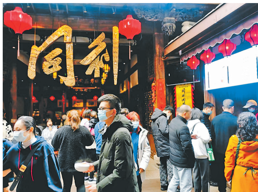
顾客排队购买福州肉燕。