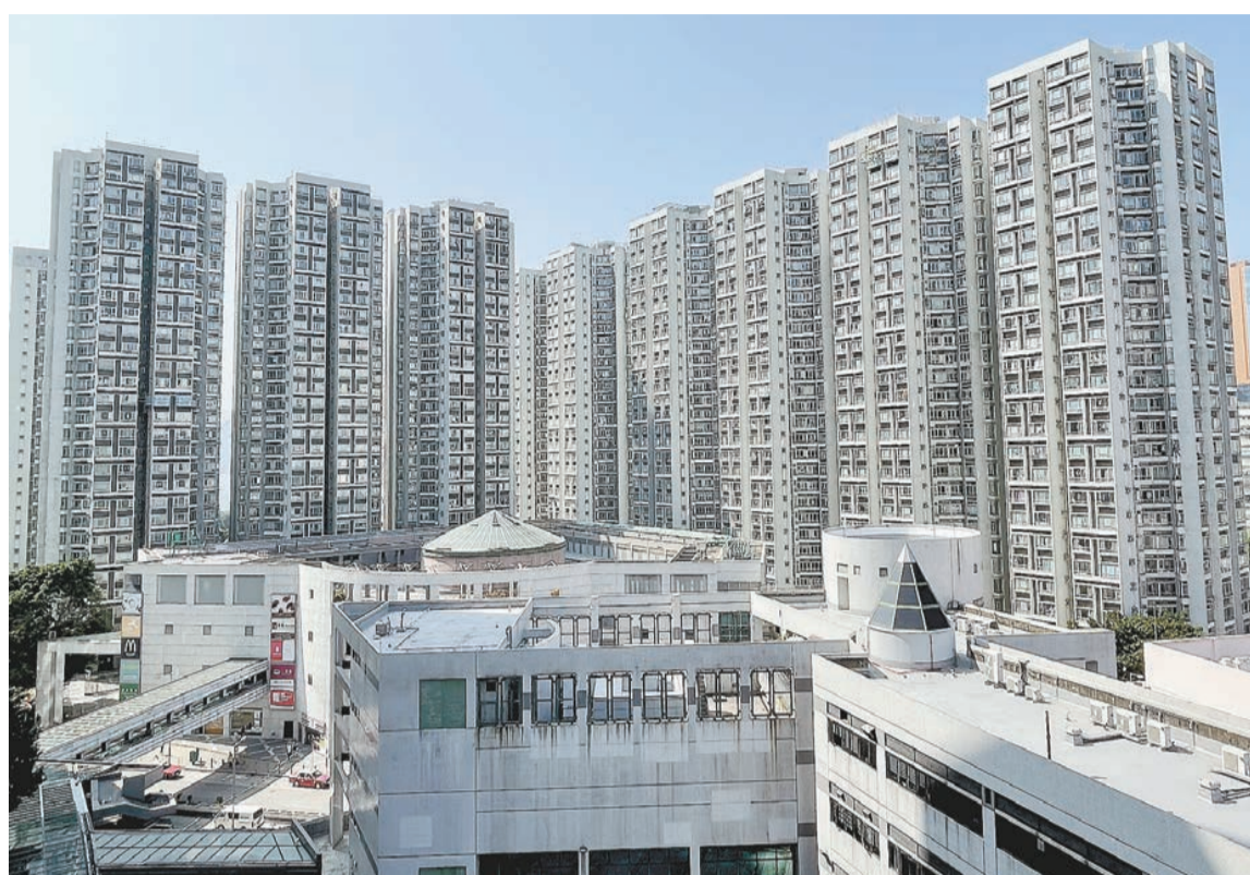
受變種病毒疫情急速升溫影響，虎年首個周末二手交投萎縮。資料圖片

【香港商報訊】記者周健鑫報道：本港第五波疫情嚴峻，受變種病毒疫情急速升溫影響，加上農曆新年節日氣氛未完全消散，虎年首個周末二手交投再度萎縮。四大代理上周末二手樓交投，以港置最標青，錄得成交11宗，較前周10宗成交微升10%。美聯、利嘉閣及中原分別錄得28.6%、30%及50%的跌幅，其中中原地產上週僅錄得6宗成交，遠低於前周的9宗。