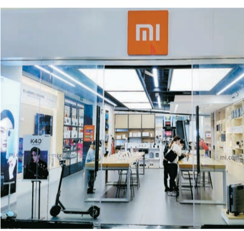
小米積極拓展海外市場，市傳該公司打算在阿根廷開始生產手機，並開設門店。

【香港商報訊】記者姚一鶴報道：外電引述知情人士透露，小米公司(1810)積極拓展海外市場，將從第一季度末開始在阿根廷火地省生產手機。知情人士表示，小米今年還打算在阿根廷開設門店。不過，小米未有評論有關傳聞。