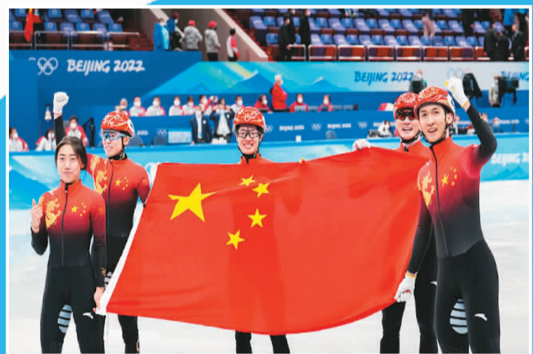
▲2月6日，中国短道速滑队夺得2000米混合接力冬奥会金牌。图为队员们在庆祝。

选手像风一样飞驰，战术千变万化——快速占位、控制与反控制、超越与反超，决胜在秒的千分位，这就是短道速滑。