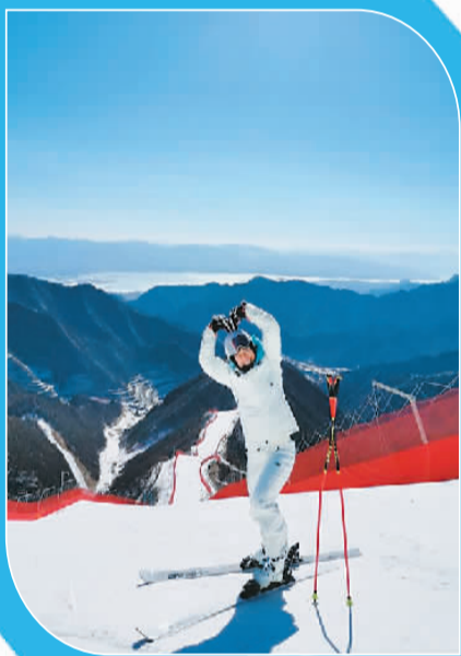
图为瑞士高山滑雪运动员温蒂·霍尔德纳在社交媒体上发文时的配图。