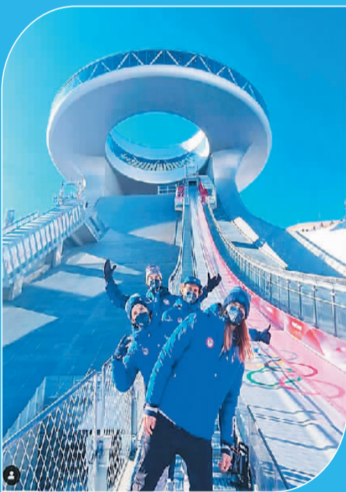
图为美国滑雪队在社交媒体上发文时的配图。