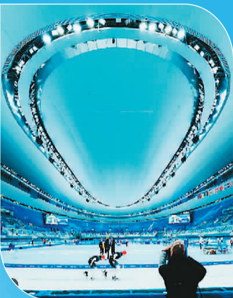
图为德国速度滑冰运动员费利克斯·里吉亨在社交媒体上发文时的配图。