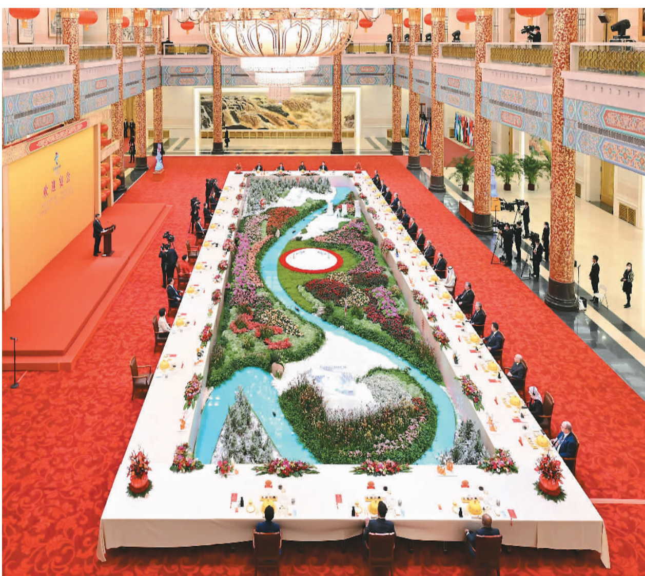
2月5日中午, 国家主席习近平和夫人彭丽媛在北京人民大会堂金色大厅举行宴会, 欢迎出席北京2022年冬奥会开幕式的国际贵宾。