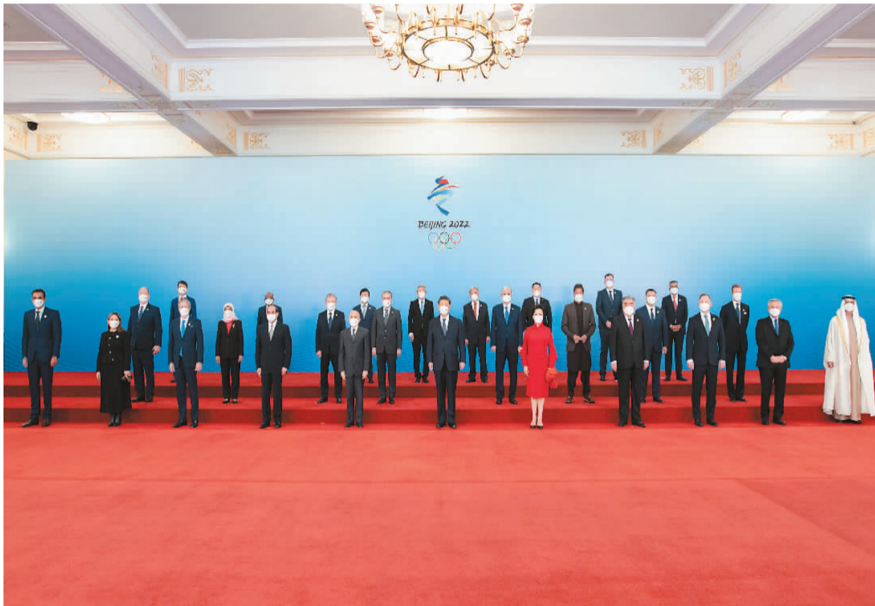
2月5日中午, 国家主席习近平和夫人彭丽媛在北京人民大会堂金色大厅举行宴会, 欢迎出席北京2022年冬奥会开幕式的国际贵宾。图为习近平和彭丽媛同国际贵宾一起合影留念。

新华社北京2月5日电 国家主席习近平和夫人彭丽媛2月5日中午在北京人民大会堂金色大厅举行宴会, 欢迎出席北京2022年冬奥会开幕式的国际贵宾。