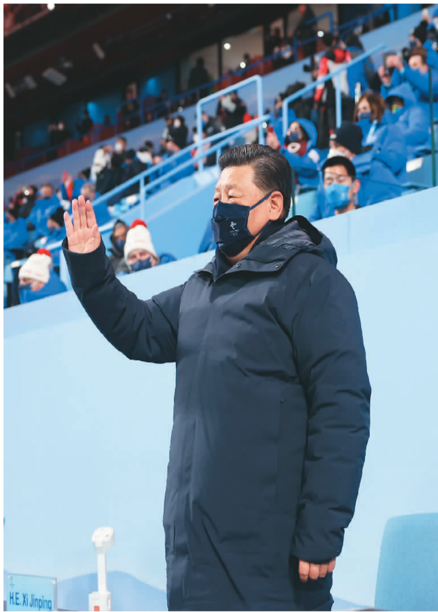
2月4日晚,北京第二十四届冬季奥林匹克运动会开幕式在国家体育场隆重举行。图为国家主席习近平在主席台上向大家挥手致意。

李克强栗战书汪洋王沪宁赵乐际韩正王岐山 国际奥委会主席巴赫 来自世界各地的领导人和贵宾等出席