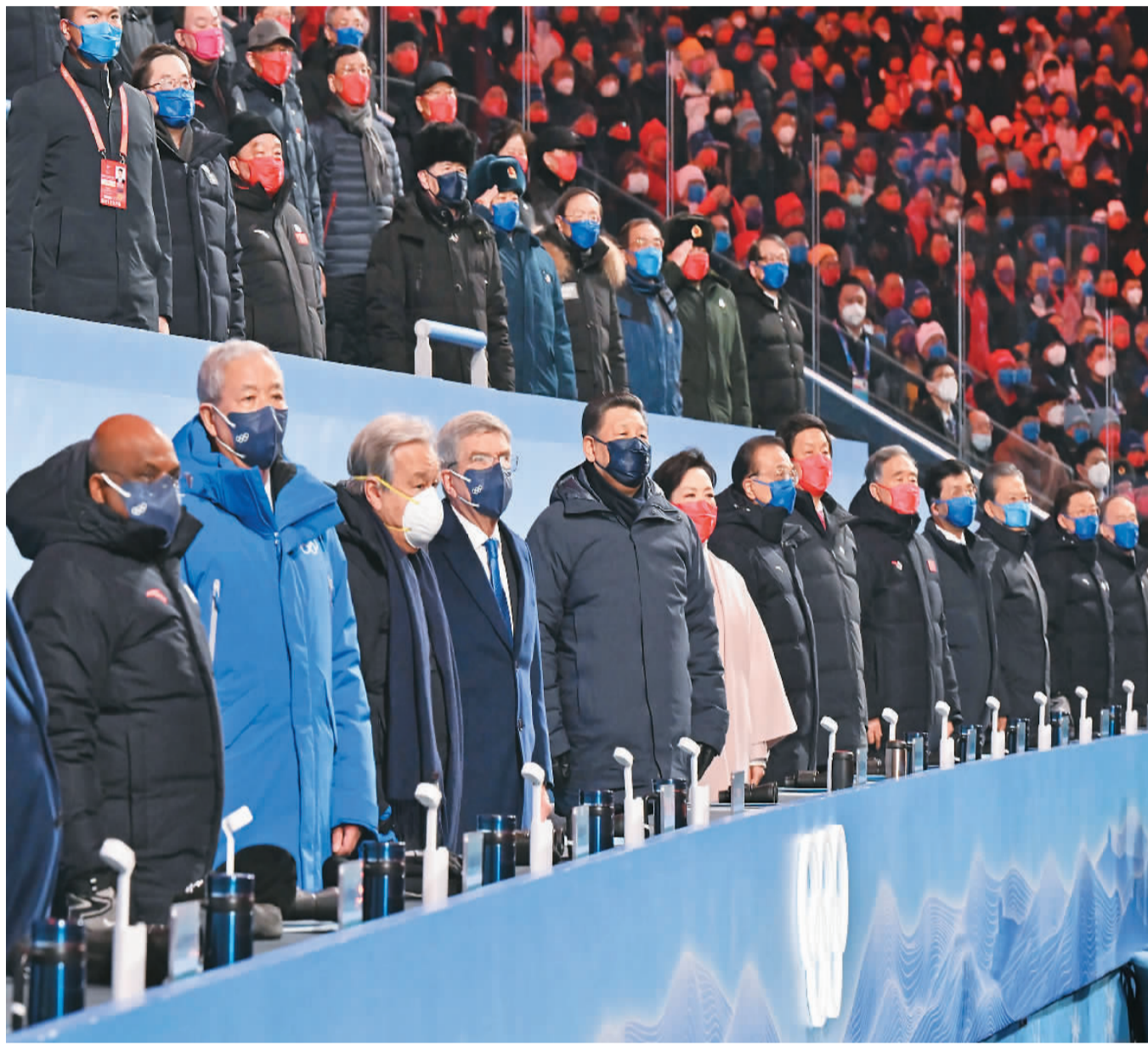
2月4日晚,北京第二十四届冬季奥林匹克运动会开幕式在国家体育场隆重举行。习近平、李克强、栗战书、汪洋、王沪宁、赵乐际、韩正、王岐山等党和国家领导人出席开幕式。

新华社北京2月4日电 筑梦冰雪,同向未来。2022年2月4日晚,举世瞩目的北京第二十四届冬季奥林匹克运动会开幕式在国家体育场隆重举行。国家主席习近平出席开幕式并宣布本届冬奥会开幕,中华文明与奥林匹克运动再度携手,奏响全人类团结、和平、友谊的华美乐章。 李克强、栗战书、汪洋、王沪宁、赵乐际、韩正、王岐山等党和国家领导人,国际奥委会主席巴赫,以及来自世界各地的领导人和贵宾出席开幕式。 夜幕下的国家体育场华灯璀璨、美轮美奂,这座以鸟巢造型闻名于世的建筑,即将创造历史,成为世界上首座举办过冬奥会和夏奥会“双奥”开幕式的体育场。