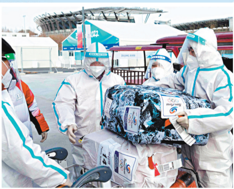
◆全套防護裝備的職員助理運送行李。