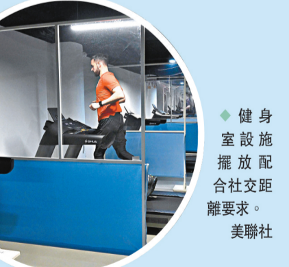
◆健身房設施擺放配合社交距離要求。