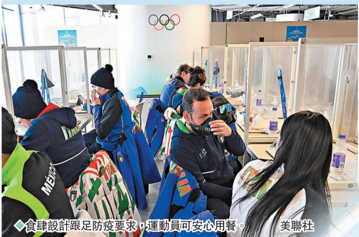
◆食肆設計跟足防疫要求，運動員可安心用餐。