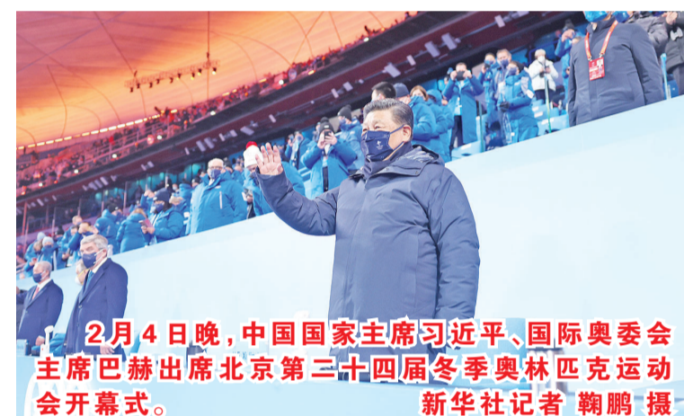
2月4日晚，中国国家主席习近平、国际奥委会主席巴赫出席北京第二十四届冬季奥林匹克运动会开幕式。