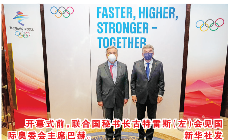
开幕式前，联合国秘书长古特雷斯(左)会见国际奥委会主席巴赫。