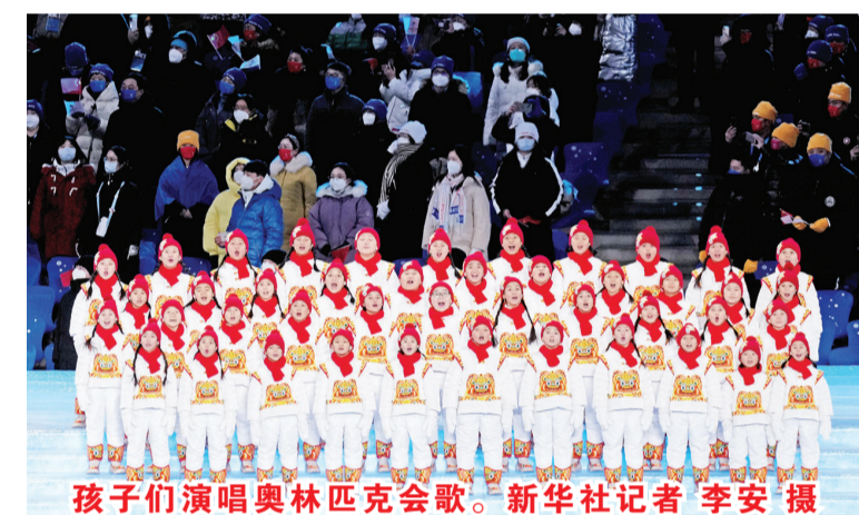
孩子们演唱奥林匹克会歌。

新华社北京2月4日电 新华社记者 风雨送春归，飞雪迎春到。2月4日，立春，来自91个参赛国家(地区)代表团的运动员齐聚北京，在见证“双奥”的国家体育场“鸟巢”共同迎接这历史性的一刻。