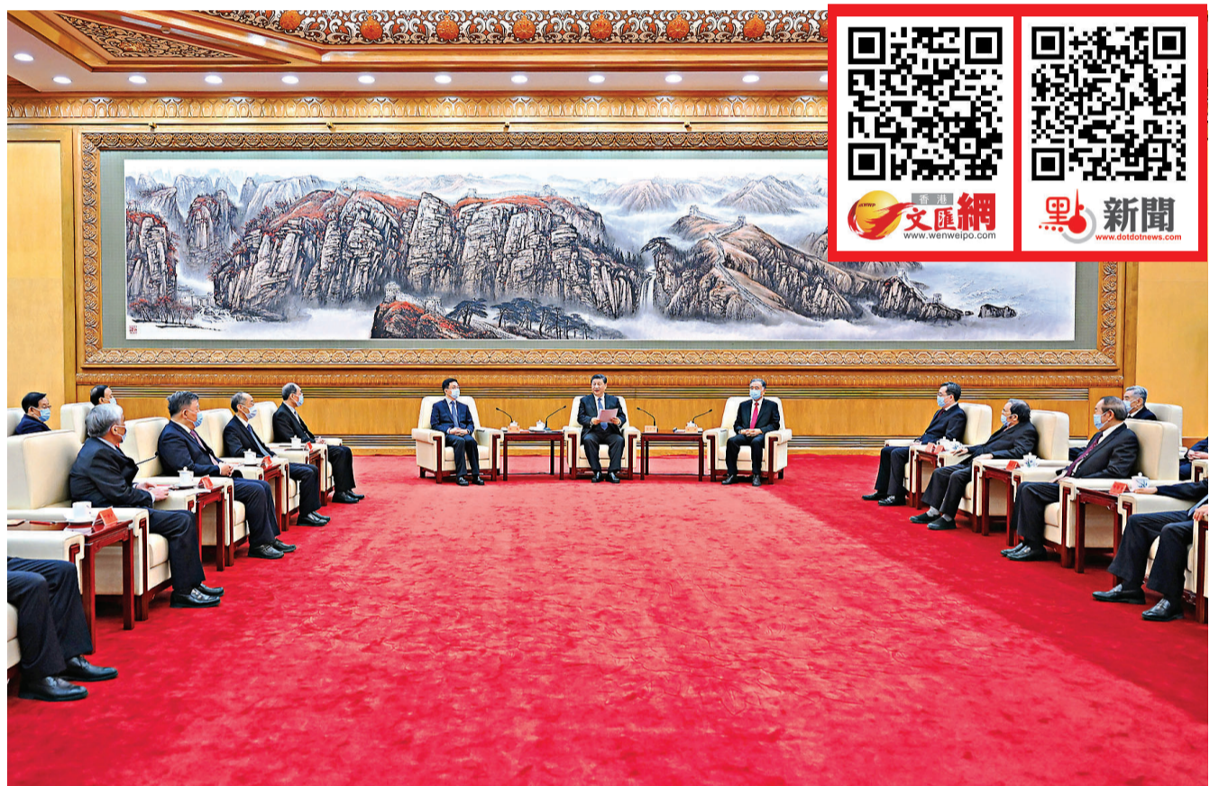
1月29日，習近平、汪洋、韓正等在北京人民大會堂同黨外人士歡聚一堂，共迎佳節。

香港文匯報訊 據新華社報道，在中華民族傳統節日壬寅虎年春节即將到來之際，中共中央總書記、國家主席、中央軍委主席習近平29日下午在人民大會堂同各民主黨派中央、全國工商聯負責人及無黨派人士代表歡聚一堂，共迎佳節。習近平代表中共中央，向各民主黨派、工商聯和無黨派人士，向統一戰線廣大成員，致以誠摯的問候和新春的祝福。