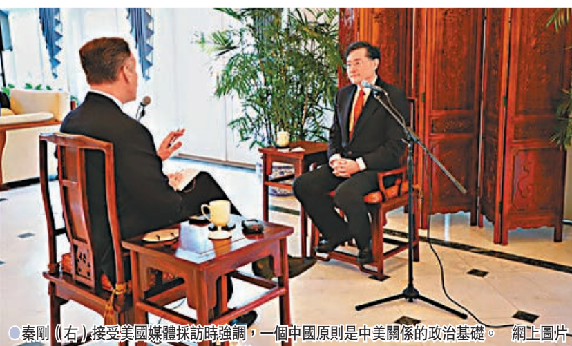
秦剛（右）接受美國媒體採訪時強調，一個中國原則是中美關係的政治基礎。

秦剛強調，台灣問題是中美之間最大的火藥桶。如果台灣當局在美方撈取利益下繼續推進「台獨」，很可能將中美兩個大國捲入軍事衝突。中國不想和美國發生衝突對抗，美國也不想和中國打仗，所以不打仗、不衝突是中美之間的最大公約數。雙方應共同阻遏「台獨」勢力，給和平一個機會，讓和平勝出。