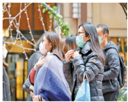
大寒後天氣寒冷，務必要注意頭部、頸部的保暖。

泡脚是養生的好方法，一年四季都適合，促進血液循環，天氣寒冷可以多泡脚，有助驅寒助眠，郭醫師建議：「晚上睡覺前泡脚，有助身體溫暖起來更能助眠，每次15至20分鐘，不要浸太長時間，以免發汗過多造成不適，可以每晚都泡。若是虛寒人士可以加溫熱藥材如當歸、肉桂、桂枝、薑。若有經期疼痛問題可加艾葉、艾草、花椒，但切記月經期間不宜泡脚。若身體容易水腫可加鹽，幫助消腫。若將藥材用熱水滾後連汁放入浸腳湯中，更能加強效果。另外泡脚前要注意有沒有皮膚問題，如果皮膚上有傷口不宜浸腳，又或有糖尿病人士要小心，因為他們的皮膚敏感度不高，有可能會浸傷皮膚而沒有知覺，有心血管疾病如高血壓也要注意時間不要浸太久。此外，泡脚後可按摩湧泉穴幾分鐘，有助促進氣血循環，讓身體更暖