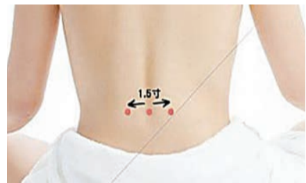
腎俞穴位於腰部第二腰椎棘突下，旁開1.5寸處，左右各一個。

氣溫寒冷容易誘發心血管疾病，因此保暖工作很重要，禦寒特別要注意保護暴露在外部位，郭醫師表示：「要特別注意保護頭部、頸部，例如大風要戴帽，頭部沒有保暖容易造成頭痛，頸部也要保暖，否則會引起氣管敏感、咳嗽等疾病。至於足部保護也不能疏忽，如睡醒不要直接腳踩地面，最好穿襪或是拖鞋，以免寒邪入腳，造成關節的痛症。疫情期間家中也要注意空氣流通，若因怕冷關上門窗，有機會困住病菌，最好每天打開門窗通風。」郭醫師並介紹兩個在腰部的穴位，分別是腎俞及命門，容易怕冷的人可以把雙手搓熱，每天花5至10分鐘按摩此兩穴位，能暖腎助陽。