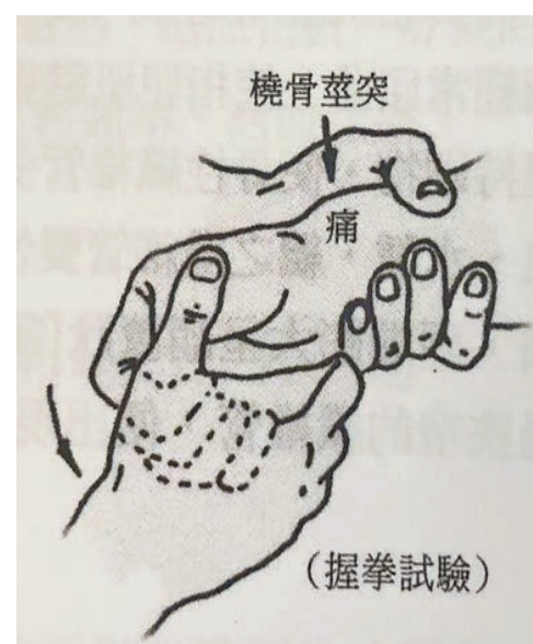
壓痛點推拿治療有助緩解手腕疼痛。

此症的發生除了外傷外，一般與手部，尤其是與大拇指反覆過度用力操作有關，所以中醫師會建議患者在治療的同時要注意手部休息，改變手部操作動作，或操作中增加手部休息次數，配合患者自我按摩及適當治療，可盡早康復。