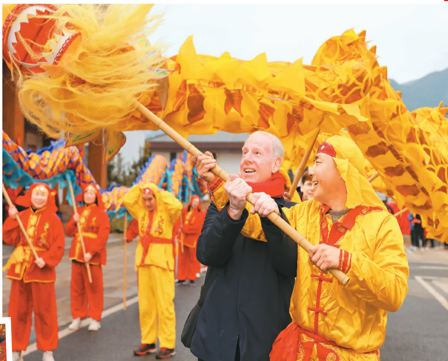
▲浙江省湖州市德清县莫干山镇仙潭村，在当地工作生活的国际友人来到乡村体验舞龙等中国传统民俗活动。

春节临近，神州大地处处洋溢着红红火火的节日氛围。在城市街头巷尾，在广袤的乡野村落，人们备年货、赏民俗，在浓浓的年味中迎接农历虎年新春的到来。