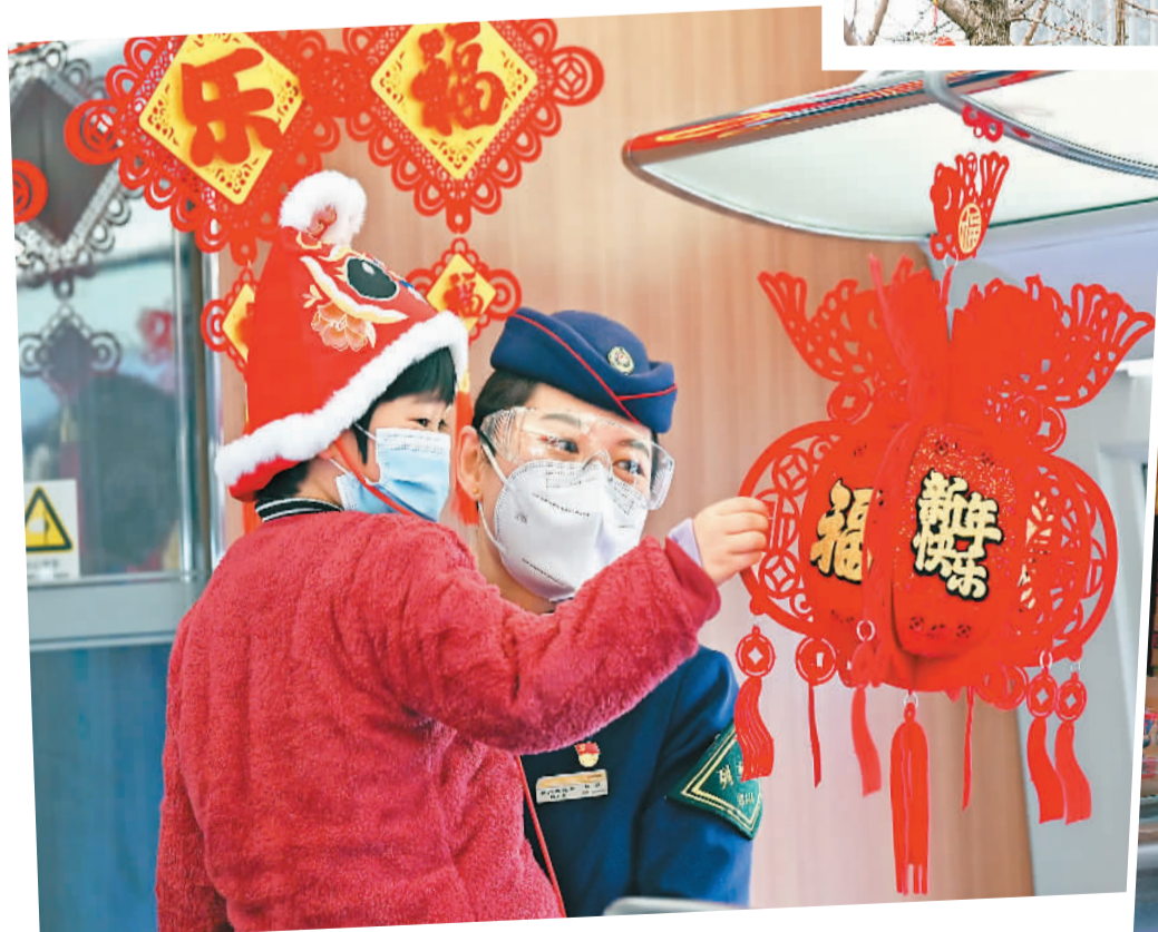
▲春运旅途中也有着浓厚的新春氛围。图为G7944次高铁乘务员与小旅客互动。 ▶侨乡广东省江门市蓬江区新市路沿街店铺挂满灯笼、春联等节日饰品，年味正浓。