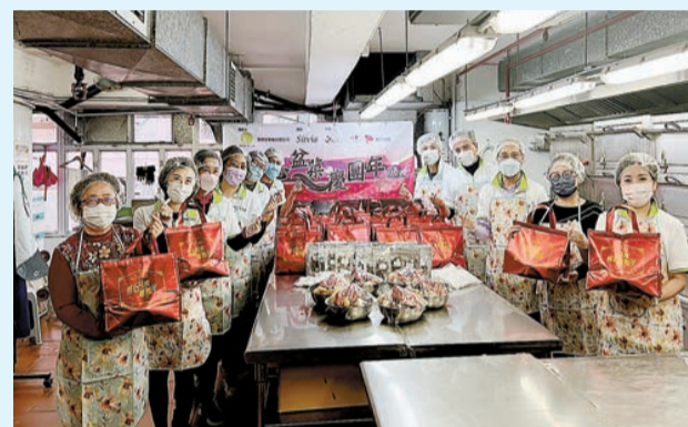
義工們製作轉贈 510 個盆菜予新界 500 戶基層家庭。

她透露，雖然今年的食材價格比去年更為昂貴，但仍決定要加碼製作 510 個盆菜，不單讓屯門區的朋友感受到愛與關懷，更希望能讓更多不同的地區市民受惠，讓這份暖意傳遞新界多區。