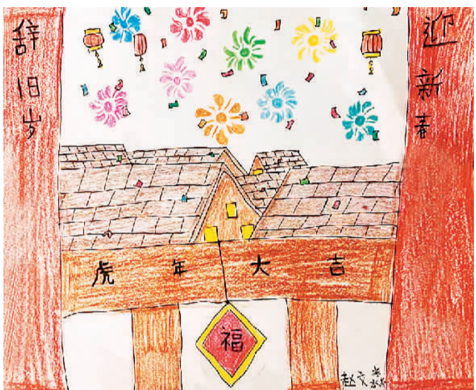
《心中的故乡》赵文森 (九岁) 作 (寄自美国)