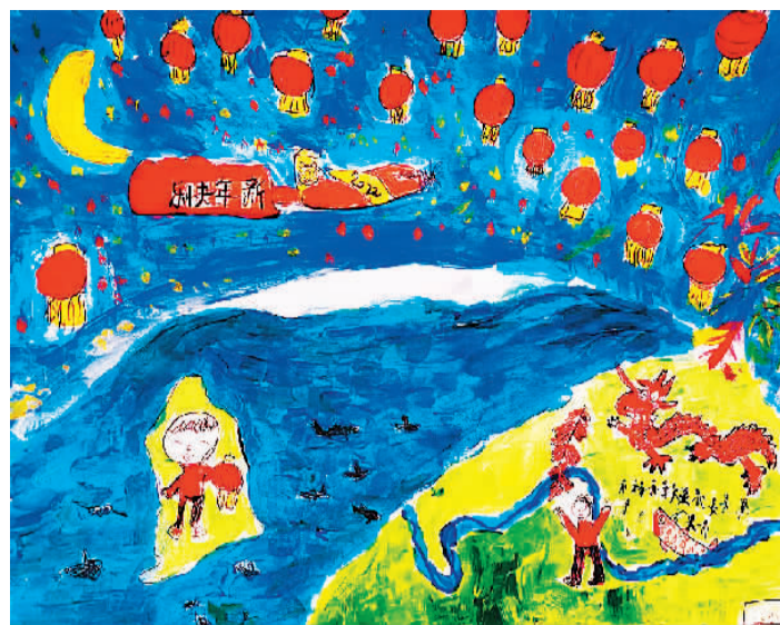
《故乡在那头 我在这头》张熙骅 (9岁) 作 (寄自英国)