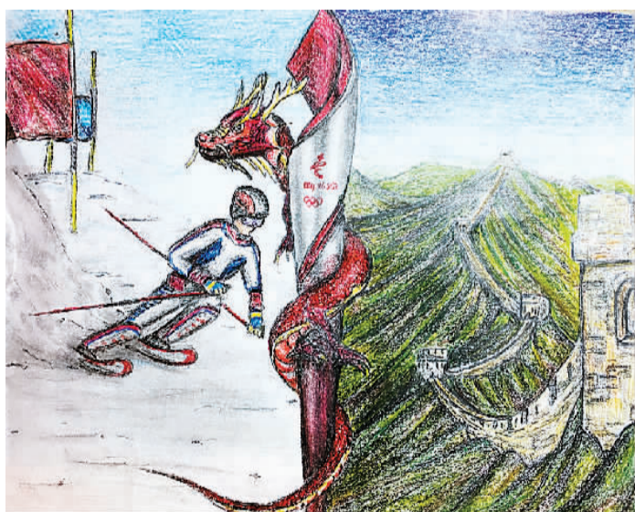
《冬奥畅想》王乙辰 (15岁) 作 (寄自德国)