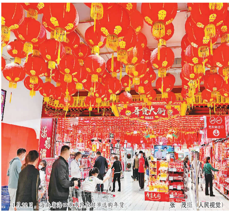
1月22日，河南省郑州市市民在超市选购年货。