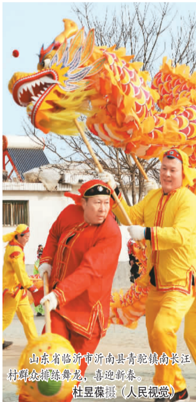
山东省临沂市沂南县青驼镇南长江村群众排练舞龙，喜迎新春。

我的老家，在豫东柘城县一个名叫“西陈庄”的村子。我们村大约有200多年历史。对我们家、我们村，乃至整个河南来说，2005年的春节都有着特殊的意义——村口路边上，报纸电视里，无不洋溢着一种喜悦：当年开始，延续了几千年的“皇粮国税”，在河南成为历史。 那时我上大三，放了寒假，坐绿皮火车回家过年。打我记事起，腊月三十晚上，家里都会打开一瓶邻县产的葡萄酒。那年也不例外，就着凉拌牛肉，喝着葡萄酒，爸妈聊起不少事儿。他们说得最多的就是，“祖祖辈辈都不敢想，种地不用交公粮了”。