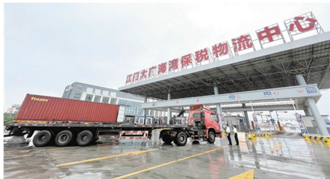
江門大廣海灣保稅物流中心(B型)封關運作以來,江門海關監管進出口貨物35.5萬噸,進出口貨物貨值累計17.7億元。

2020年7月,江門大廣海灣保稅物流中心(B型)(以下簡稱“江門B保”)正式封關運作,開展了保稅倉儲、國內貨物進出流轉等多項業務。