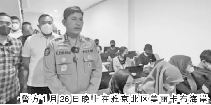
警方1月26日晚上在雅京北区美丽卡布海岸(PIK)破获非法网贷公司。

币(Uang Rodi)、担保贷款(Pinjaman Terjamin)、够贷款(Go Kredit)、母基金(Dana Induk)和在线基金(Dana Online)等。非法网贷公司共拥有99名员工,包括1名经理和98名员工。目前尚不清楚有多少员工是未成年人。所有非法网贷的员工和管理人员都被押送到雅京警区进行深入调查。 朱尔坂指出,这种非法网贷行为违反了两项法律,即信息与电子交易法和消费者保护法。经法网贷应用程序,包括安全基金(Dana Aman)、罗迪