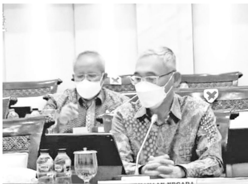
希拉坂于1月26日在第十一委员会听证会上披露财政部犯罪雇员的作案过程。

【本报讯】财政部国家财富总署证实,伪造央行援金(BLBI)土地抵押资产的雇员为1人,而不是11人。财政部国家财富局长