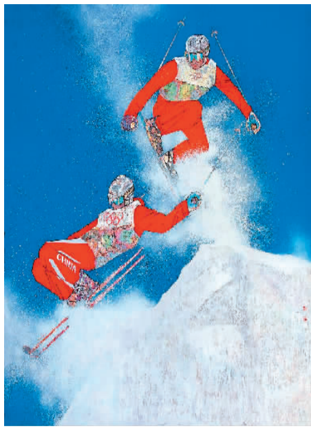
巅峰舞雪（中国画）高毅、黄华三