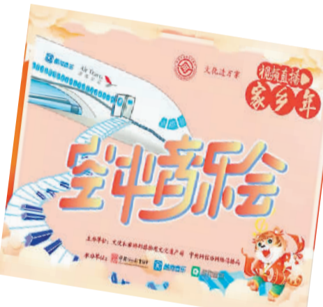
“空中音乐会”海报

形如元宝、皮薄馅大的仙鹤水饺，古法酿造、芳香四溢的承李记酒……宁夏文化馆在B站上传的视频《舌尖上的银川年》，看得人垂涎三尺，隔着屏幕都好似能闻到香味。网友在弹幕中留言说：“吃咱的饺子，就着咱地道的高粱原浆酒，舌尖都是宁夏的味道。”在B站搜索话题“我的家乡年”，还有许多展现全国各地非遗民俗、传统文化的短视频。《水韵江苏·年味里的泰州非遗》里，有姜堰撘石锁、泰州淮剧、泰兴木偶戏、沙沟板凳龙舞等非遗技艺；《中国年·湖南味》中，有郴州汝城火龙表演和制作