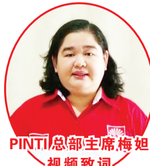
PINTI总部主席梅姐视频致词