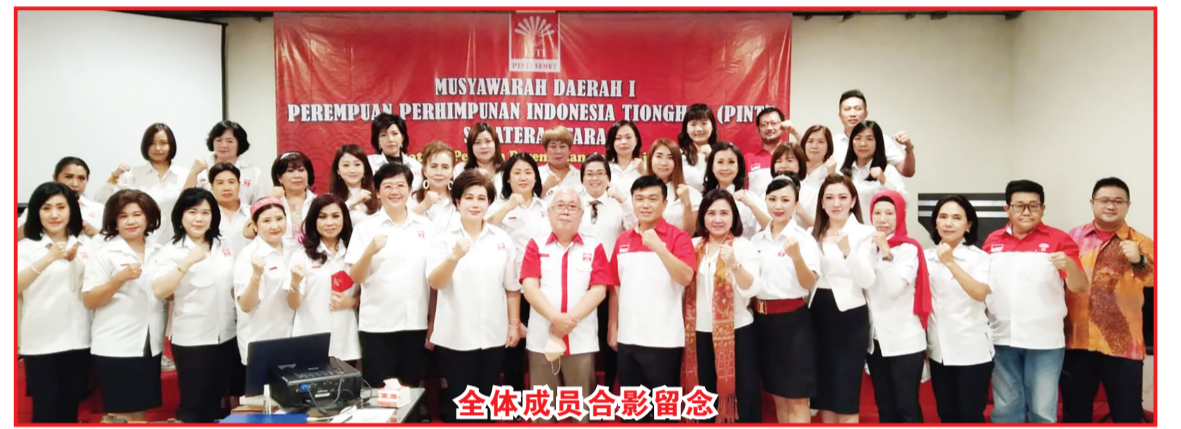
全体成员合影留念