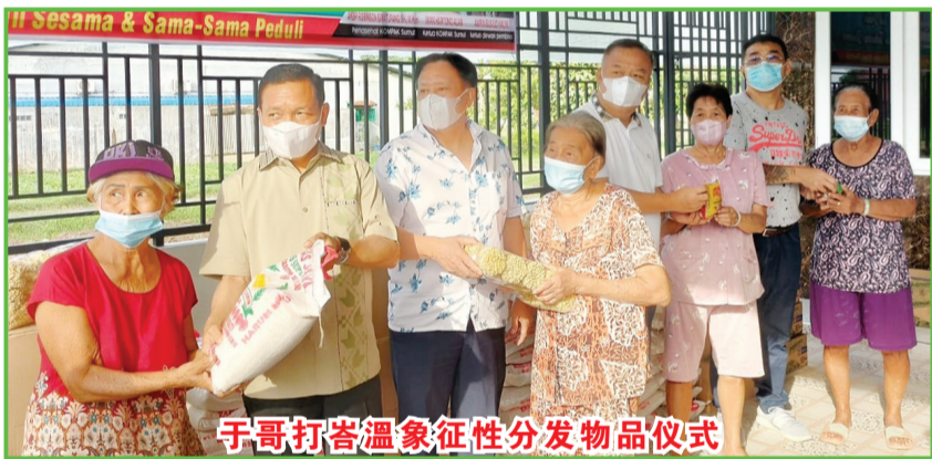
于哥打峇温象征性分发物品仪式