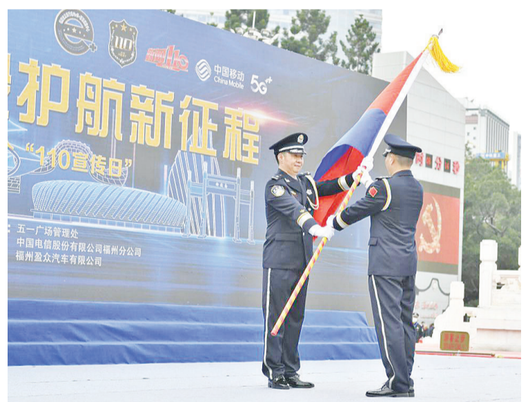
福州市副市长、市公安局局长王锡章为福州市公安局指挥中心授旗。

2022年1月10日，福州市公安局正式启动“海外110报警服务台”，专席受理海外福州籍华人华侨电话报警求助服务。这是中国首个“海外110报警服务台”，在(境)外的福州籍华人华侨可通过手机拨打0086-591-110报警求助。“海外110报警服务台”接警员将依据要求，对相关事项立即开展受理、询问、登记和处置等工作。对发生在福州区域