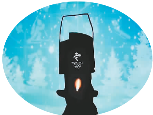
《冰雪聪明》节目中的奥运火种灯

《冬日暖央young》以“燃情冰雪季,主播嘉年华”为口号,集合中央广播电视总台众多优秀主持人组成战队,以文艺竞演+冰雪运动的创新形式,用主持人的第一视角和年轻化、幽默化的语态,推广冰雪