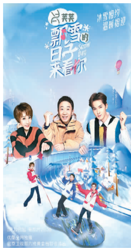
《飘雪的日子来看你》海报