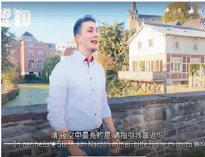
2021年度“唱歌学中文”音乐视频全球征集活动视频展映截图。

德国伯尔高级文理中学中文合唱团用音乐搭建起交流桥梁正是例证。伯尔高级文理中学位于德国北威州，1994年起便开设了中文课程，2014年成立中文合唱团。合唱团多次参加中德文化交流活动，在中德语言年、2016中德青少年交流年等系列活动，都留下了他们的歌声；2020年，合唱团录制了中文歌曲《让世界充满爱》，为中国人民抗击疫情加油；2021年1月，中文合唱团的4名同学合作录制演唱了中文歌曲《疫情过后》，感情真挚、中文地道，打动了无数人。