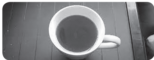
ilustrasi teh hitam.

Hipertensi sendiri adalah kondisi kesehatan yang cukup banyak mempengaruhi manusia. Kondisi ini ditandai dengan aliran darah yang tinggi dan konstan di arteri yang memberi tekanan dan menyebabkan kurangnya elastisitas.