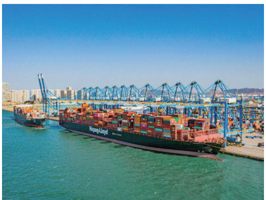
【青島RCEP航運指數發布】