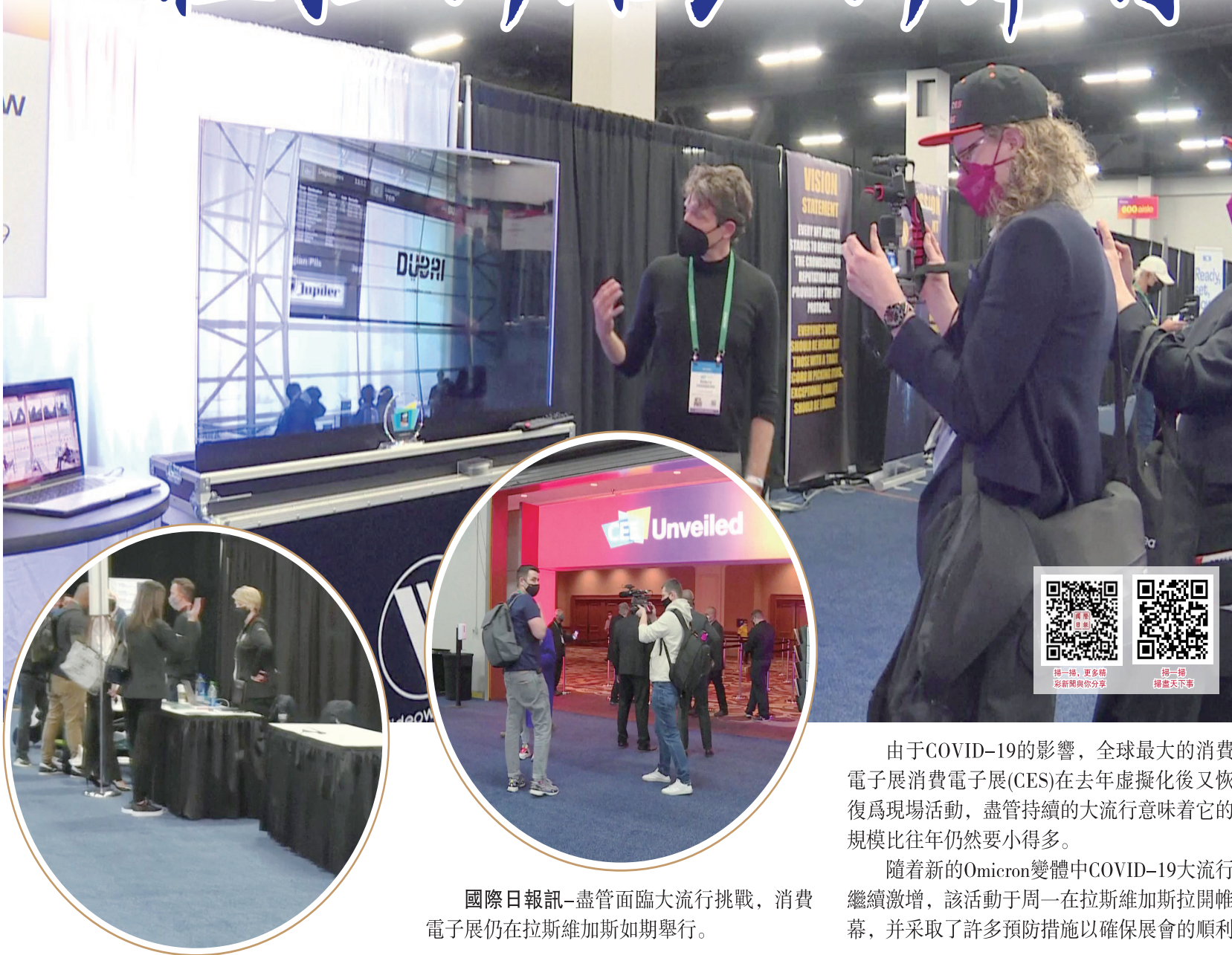
國際日報訊—儘管面臨大流行挑戰，消費電子展仍在拉斯維加斯如期舉行。

由于COVID-19的影響，全球最大的消費電子展消費電子展(CES)在去年虛擬化後又恢復為現場活動，儘管持續的大流行意味著它的規模比往年仍然要小得多。